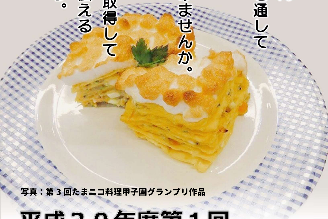
写真：第3回たまご料理甲子園グランプリ作品